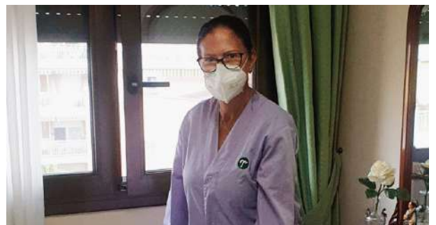
A prop: Mutuam a Casa