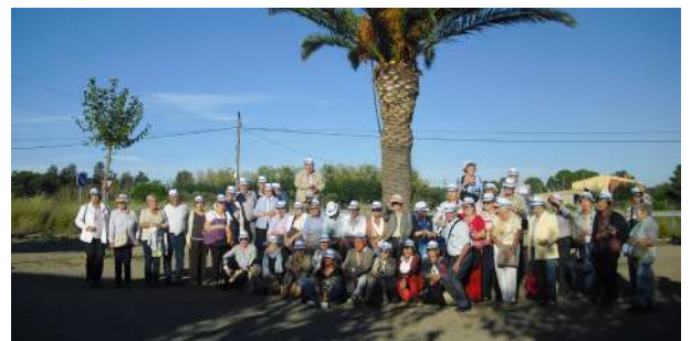
Activa't: reprenem les sortides