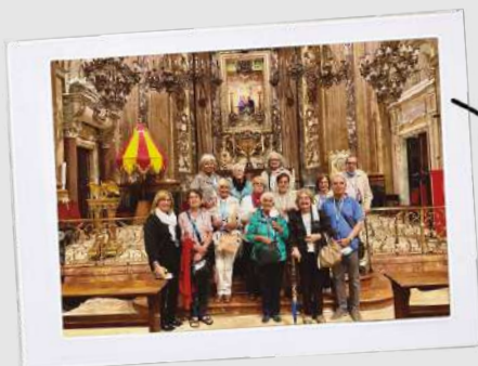
Basilica de la Mercè

Del barroc sacre als murals i grafitis, aquests mesos hem gaudit de l'art en totes les seves formes i facetes! A Penelles, Lleida, vam poder visitar un museu a l'aire lliure, ja que tot el poble està cobert de magnífiques obres murals; mentre que a la basílica de la Mercè vam descobrir els secrets d'un dels indrets més emblemàtics de Barcelona.